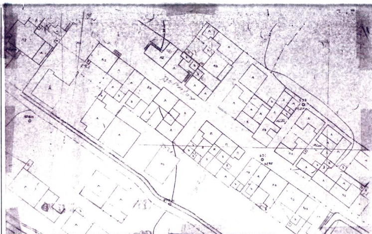
ΑΠΟΣΠΑΣΜΑ ΕΓΚΕΚΡΙΜΕΝΟΥ ΡΥΘΜΟΤΟΜΙΚΟΥ ΣΧΕΔΙΟΥ ΠΑΤΡΩΝ ΑΡ. ΠΙΝΑΚΙΔΩΝ 166-176