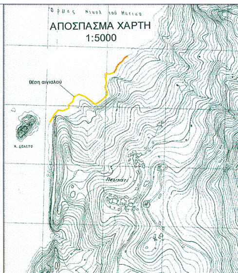
ΠΙΝΑΚΑΣ ΣΥΝΤΕΤΑΓΜΕΝΩΝ ΚΟΡΥΦΩΝ ΑΙΓΙΑΛΟΥ