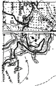
Απόσταση 9 Χ. Κερκερών κλίμακα 1:50.000 ΓΥΣ Δ 113

Κλίμακα 1: 1.000 Εμβαδόν (1,2,...,24,25,1)=2,80 στρέμματα