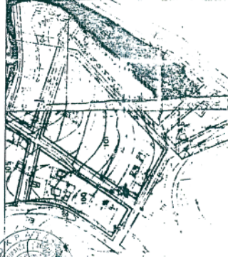
ΑΠΟΤΥΠΩΜΑ ΓΡΗΘΟΛΟΓΟΥ ΔΙΑΓΡΑΜΜΑΤΟΣ ΣΕ ΚΑΛΩΣ 1 : 2000

ΥΠΟΜΗΝΙΑ Ρ.Γ. ΠΕΡΙΜΕΤΡΟΣ Ο.Γ. ΟΡΟΛΙΑ Ρ.Γ. ΚΑΤΑΓΟΜΕΝΟΣ Ο.Γ. ΟΡΟΛΙΑ