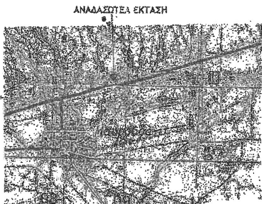
ΚΑΤΑΤΟΠΗΣΤΙΚΟΣ ΧΑΡΤΗΣ ΚΛΙΜΑΚΑ 1:50.000

ΕΘΝΙΚΟ ΤΥΠΟΓΡΑΦΕΙΟ Για τεχνικούς λόγους στο σχεδιάγραμμα, από το ηλεκτρονικό αρχείο, έγινε σμίκρυνση κατά ποσοστό 87%