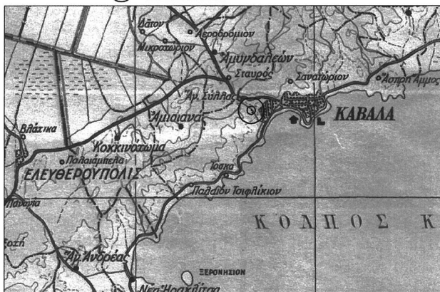
ΧΑΡΤΗΣ ΠΡΟΣΑΝΑΤΟΛΙΣΜΟΥ ΚΛΙΜΑΚΑ 1:200000 Θέση επέμβασης

Το παρόν αποτελεί αναπόσπαστο μέρος της υπ' αριθ. 237444/21.5.2024